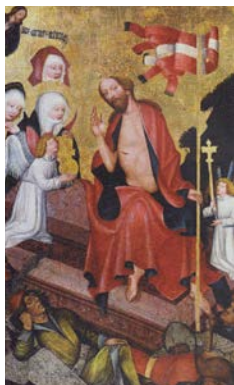
Tzv. Mistr Rajhradského oltáře, Zmrtvýchvstání Krista, kolem r. 1452