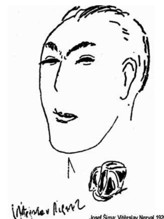
Josef Šíma: Vítězslav Nezval 1926

Moravan narozený v Biskoupkách u Moravského Krumlova, kterému učarovala Praha, Paříž i Moskva, odkryje nejen svůj literární talent na výstavě v Památníku písemnictví na Moravě.